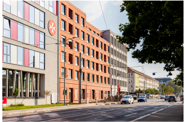
Objektansicht Riebeckstr. 33, 35