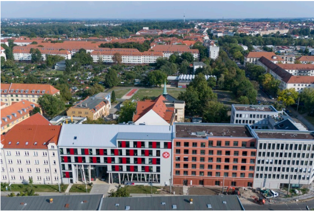
Campus Lorenzo von oben