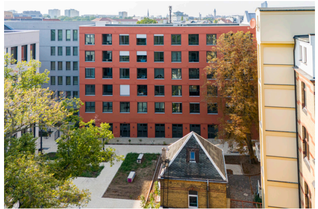
Campus Lorenzo Innenhof